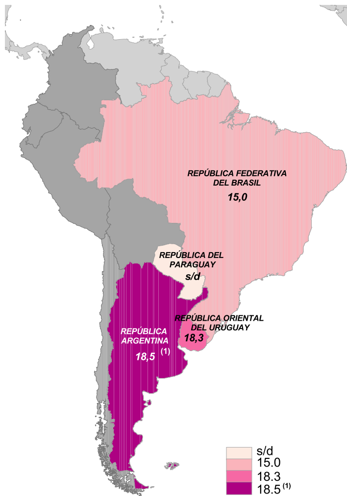
Tasa de desempleo